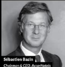
Sébastien Bazin Chairman & CEO, AccorHotels